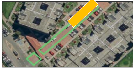
ZONA 3 - 1: SE DIVIDIRÁ EL PRIMER TRAMO (ZONA 1) EN 4 TRAMOS; EL PRIMERO IRÁ EN EL PUNTO CONTIGUO A INTERIOR 5 HASTA KM 0+017, POR EL TOTAL DEL ANCHO DE LA