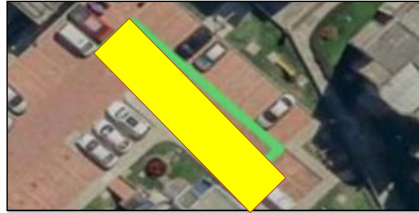
ZONA 1: ZONA UBICADA EN LA PARTE POSTERIOR DEL CR, COTIGUO AL EDIFICIO DE LA SEDE SOCIAL.