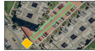
ZONA 3 - 4: SE DIVIDIRÁ EL PRIMER TRAMO (ZONA 2) EN 4 TRAMOS; EL CUARTO IRÁ PORTON VEHICULA HASTA VIA CALLE 87