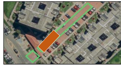
ZONA 3 - 3: SE DIVIDIRÁ EL PRIMER TRAMO (ZONA 2) EN 4 TRAMOS; EL TERCERO IRÁ DESDE KM 0+034 HASTA KM 0+049 POR EL TOTAL DEL ANCHO DE LA VÍA.