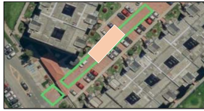
ZONA 3 - 2: SE DIVIDIRÁ EL PRIMER TRAMO (ZONA 2) EN 4 TRAMOS; EL SEGUNDO IRÁ DESDE KM 0+017 HASTA KM 0+034 POR EL TOTAL DEL ANCHO DE LA VÍA.